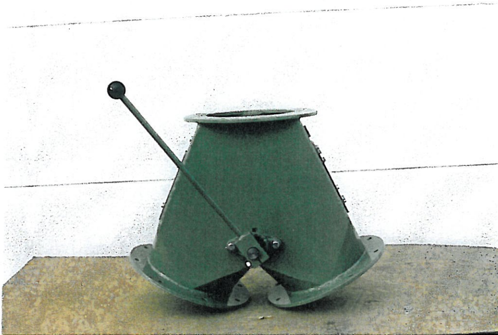
Zweiwegeverteiler rund symmetrisch mit Handhebel